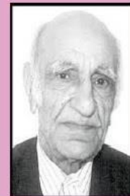
محمد ابراهیم باستانی پاریزی در سوم دی ماه ۱۳۰۴ خورشیدی در پاریز، از توابع شهرستان سیرجان در استان کرمان متولد شد.

به علاوه کتاب‌های باستانی پاریزی معمولاً پاورقی‌های بسیار مفصلی دارند که گاهی از خود متن هم مفصل‌تر است.